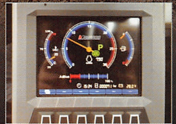
視認性の良い 大型モニター