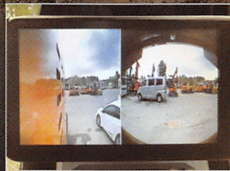
視認性抜群 バックカメラ