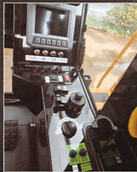
シンプルな 操作スイッチ配置