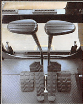
好評の二本レバーで 楽々操作